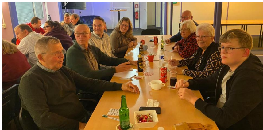
Opperste concentratie tijdens de bingo!