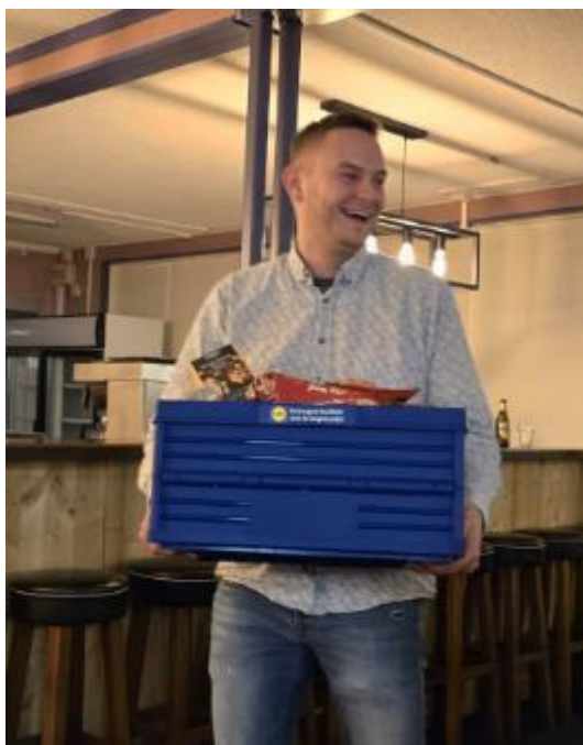
De winnaar met een vol krat met mooie producten van de Lidl uit Klazienaveen.